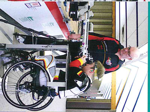
Durch Beihilfe und Sponsoring lassen sich kostenintensive Projekte verwirklichen.

Fazit: Ins Schützenheim Rickensdorf können jetzt wieder alle Mitglieder problemlos hineinkommen. Dank der Förderung konnte auf zusätzliche Ausgaben des Vereins verzichtet werden und das Bauen war auch noch eine ungewohnte, aber vergnügliche, Vereinsaktivität.